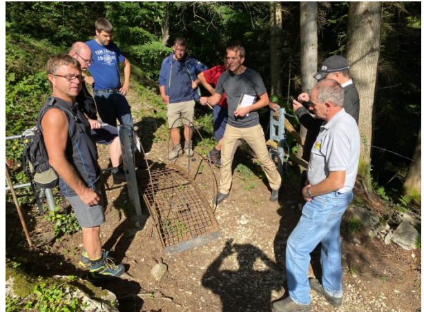
Besprechung beim Bike-Übergang am Wander- und Bikeweg zum Unteren Strüssler

Mit der Anpassung des Jagdgesetzes vom 20. April 2021 wird der Einsatz von festen Zäunen und insbesondere Stacheldrahtzäunen zum Schutze der Wildtiere und des Lebensraumes eingeschränkt. Stacheldrahtzäune müssen im Wald und an den Waldrändern abgebaut oder zumindest während der nichtbeweideten Zeit abgelegt werden. Es gilt eine Übergangsfrist von 4 Jahren.