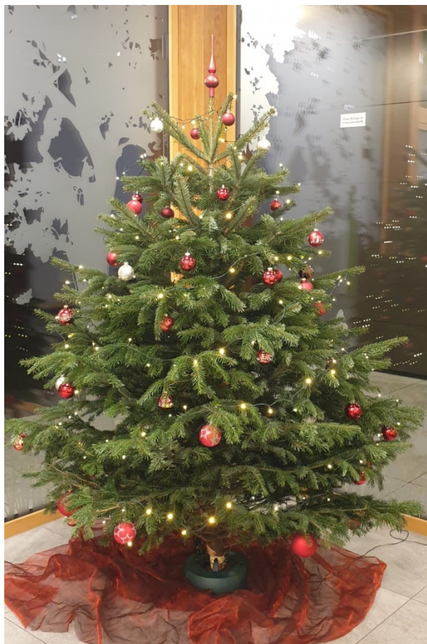
Weihnachtliche Stimmung im Foyer des Ortsgemeindesaals Eichenwies, geschmückt von der Hauswartin Katja Schöb

Für die Betreuung und die Reinigung des Ortsgemeindesaals bedankt sich der Ortsverwaltungsrat bei der engagierten Hauswartin Katja Schöb.