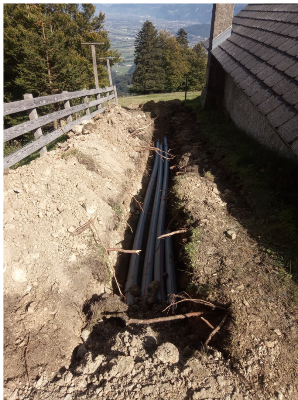
Zuleitungen und Leerrohr