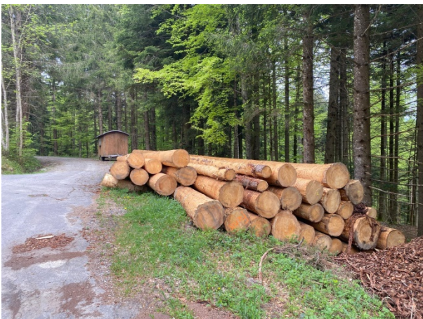
Rundholz für die heimischen Sägereien beim Eichenwieserrank

Obwohl die Ostschweizer Sägewerke zum Jahresbeginn einen guten Auftragsbestand hatten und mit voller Leistung produzierten, bewegten sich die Rundholzpreise weiterhin auf einem historischen Tief. Aufgrund der Schnittholzsituation im angrenzenden Ausland stiegen im Frühling die Bestellnachfragen im Inland wöchentlich. Diverse Sägewerke konnten keine Bestellungen von Neukunden mehr annehmen und auch der Bedarf der bestehenden Kunden konnte zunehmend nur noch knapp abgedeckt werden. Der kühle Frühling hemmte auch die Borkenkäferentwicklung. Es kam dann auch bedeutend weniger Schadholz auf den Markt als ursprünglich angenommen wurde. Ab Juni war der Markt aufgrund der enormen Nachfrage praktisch leer. Es gab kaum noch unverkauftes Frisch- oder Schadholz. Folglich sind dann auch die Rundholzpreise merklich angestiegen. Eine Erhöhung der Rundholzpreise war für den Waldbesitzer zwingend nötig. Die aktuellen Rundholzpreise dürften nun Waldbesitzer dazu veranlassen, ihre zurückgestellten Holzschläge auszuführen. Damit kann und soll auch die Versorgung der heimischen Sägerei-Industrie weiterhin gewährleistet werden.