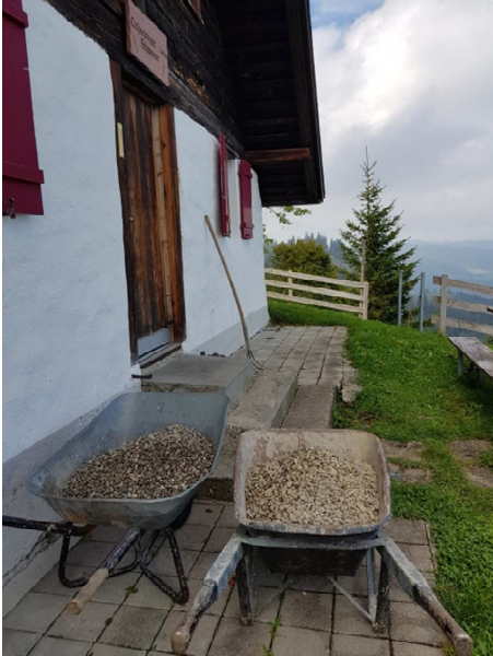
Der Keller ist geräumt.