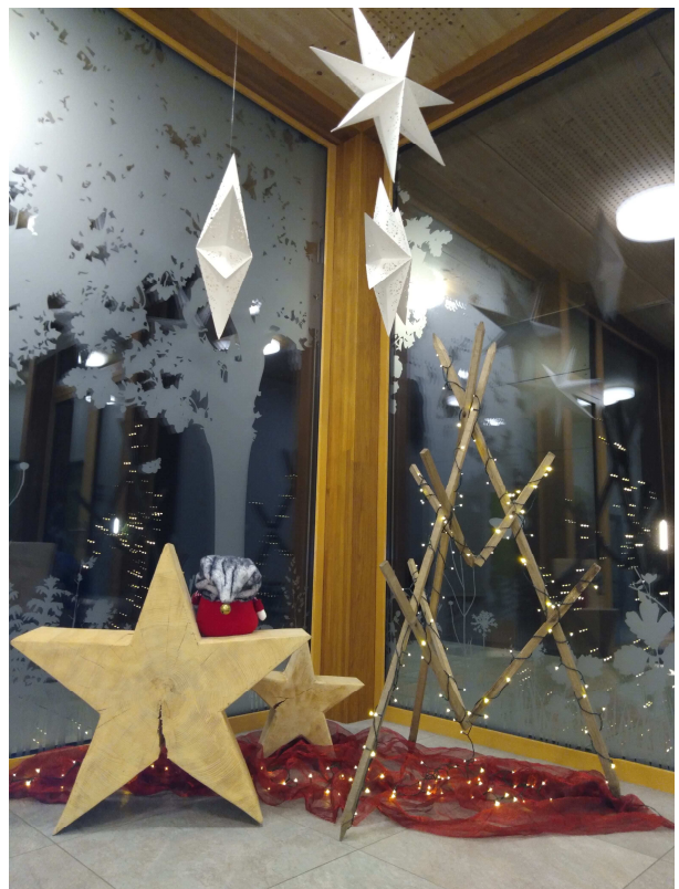
Weihnachtsdekoration 2020 im Ortsgemeindesaal Eichenwies, geschmückt von der Hauswartin Katja Schöb

Für die Vermietung und die Reinigung des Ortsgemeindesaals bedankt sich der Ortsverwaltungsrat bei der engagierten Hauswartin Katja Schöb.