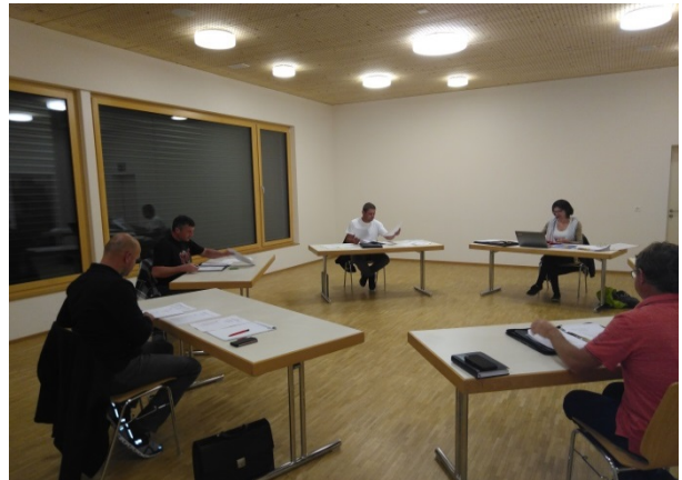
Die Verwaltungsratssitzungen fanden mit vorgeschriebenem Mindestabstand im grossen Raum im Ortsgemeindesaal statt.

Der Ortsverwaltungsrat freut sich, wenn im Jahr 2021 wieder vermehrt Hochzeiten, Apéros, Schulungen, Sitzungen und private Anlässe im Ortsgemeindesaal durchgeführt werden.