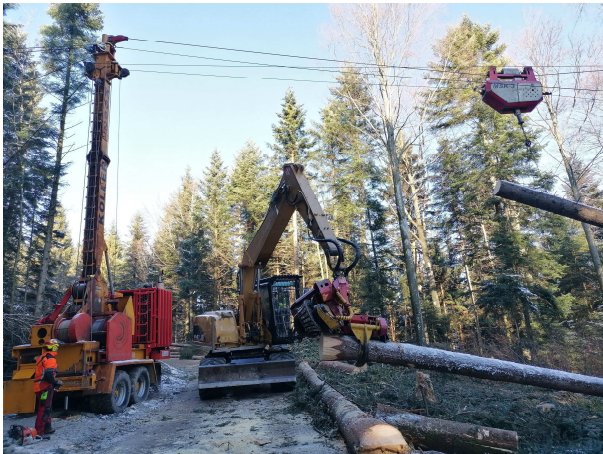
Holzbringung mit einem Mobilseilkran und Holzaufbereitung mit einem Bagger-Prozessor beim Wogweg im Februar 2020

Der Lockdown im Frühling und die stark steigenden Neuinfektionen im Herbst haben jedoch dazu geführt, dass praktisch keine Begehungen mit der Bevölkerung durchgeführt werden konnten. Während des Lockdowns im Frühling haben sich jedoch auffallend viele Leute im Wald aufgehalten. Die Holzschlaganweisung 2020 fand am 2. September statt. Infolge eines Bike-Unfalls musste sich der Regionalförster Näf Philipp kurzfristig entschuldigen. An der Begehung im Wald wurde ein illegaler Bike-Trail bei der Kienbergbrücke begangen und die dadurch entstandene Problematik für die Waldbewirtschaftung diskutiert. Beim Wogweg konnten sich die Begehungsteilnehmer ein Bild über die Holznutzung mit der Mobilseilbahn und einem Bagger-Prozessor machen.