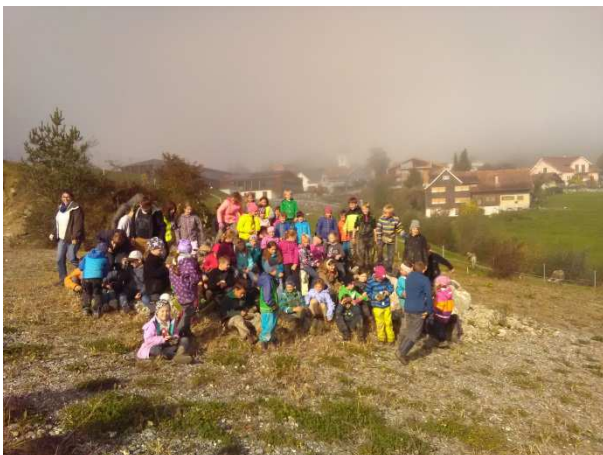
Revierförster bei einer Waldführung mit einer Schulklassen

Die Freizeitaktivitäten im Wald nehmen ständig zu. Der erhöhte Erholungsdruck beeinträchtigt auch zunehmend die Natur selber. Gerade die Wildhut und Jägerschaft wird zunehmend von anderen Waldbesuchern, im speziellen Mountainbiker und Downhill-Fahrer, verbal angegriffen. Diese Gruppierung ist sich meist nicht bewusst, dass es gerade der Jagd zu verdanken ist, dass bei uns so ein artenreicher Wald heranwächst. Das kantonale Waldgesetz erlaubt das Velofahren im Wald nur auf Strassen, nicht jedoch im Gelände. Dies wird leider immer häufiger missachtet. Daher wird von allen Waldbesuchern, insbesondere von den Mountainbikern und Downhill-Fahrern eine erhöhte Bereitschaft zur Rücksichtnahme erwartet.